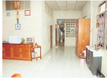
ภาพภายในบ้าน