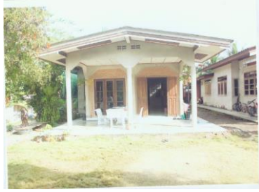
ภาพตัวบ้าน